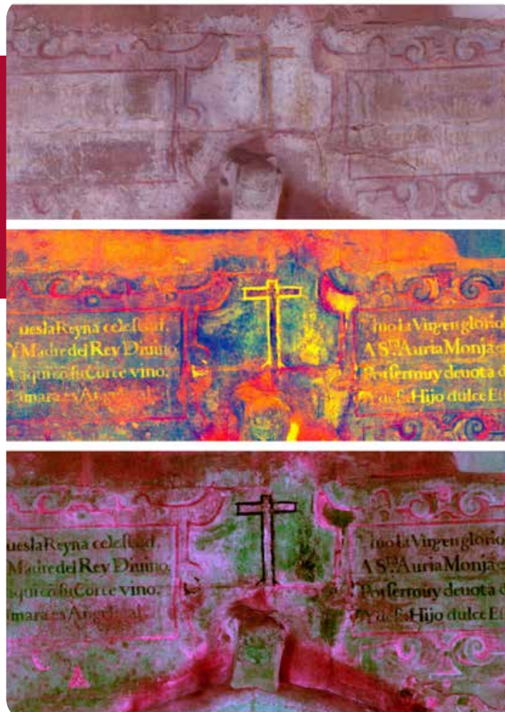
Proceso de aplicación de los filtros para una correcta lectura del texto pintado por encima del arco gótico por medio del DStretch.

Esta técnica nos permite observar detalles y coloraciones antes no visibles.