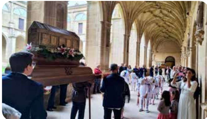
Procesión en el claustro de Yuso

El pasado 24 de septiembre, como manda la tradición y nuestros Estatutos vigentes desde 1974, los miembros de la Asociación de Amigos de San Millán de la Cogolla, acompañados por los Padres Agustinos Recoletos del Monasterio de Yuso y por los vecinos de pueblo de San Millán de la Cogolla y por quien quiso acompañarnos, celebramos el día de la Traslación y la fiesta de nuestra Asociación.