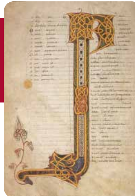
Códice Emilianense 46

imágenes presentan tanto una mayor madurez como un cierto sentido del volumen, con figuras más alargadas que presentan una mayor movilidad y un plegado con ondulaciones, mucho más realista que en las de la fase mozárabe.