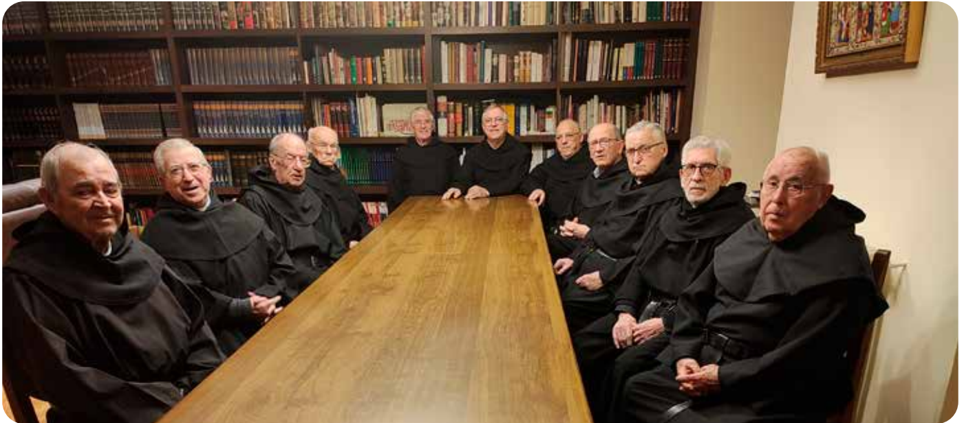
Comunidad agustino-recoleta del monasterio de Yuso