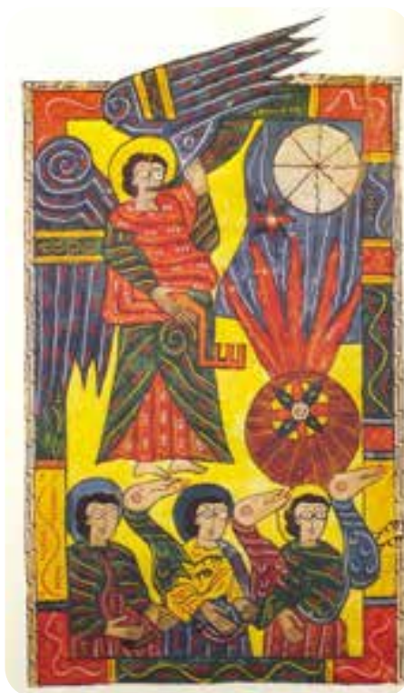
Beato de El Escorial

El estilo de la segunda fase es muy diferente; iluminada por varios manos de poca calidad excepto la última parte, hecha por un miniaturista de mayor calidad, plenamente románico. Sus