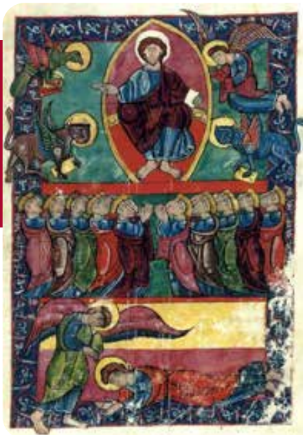
Beato de San Millán