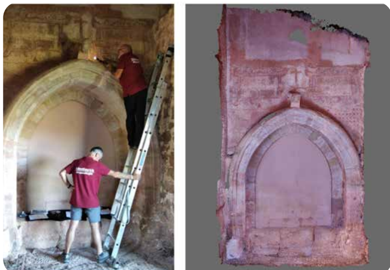
Fotografía y el resultado del modelo fotogramétrico del arco gótico del Portaleio.

El tratamiento de las imágenes tomadas para la elaboración de los modelados 3D para procesar la pintura con el DStretch , se ha realizado a través del programa Agisoft Metashape Professional ®.