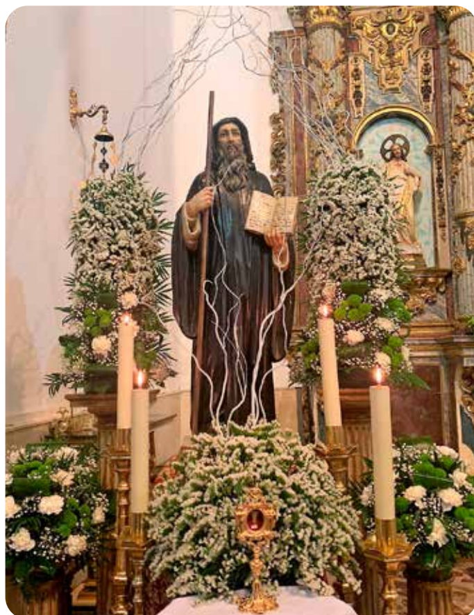
Santo y Reliquia