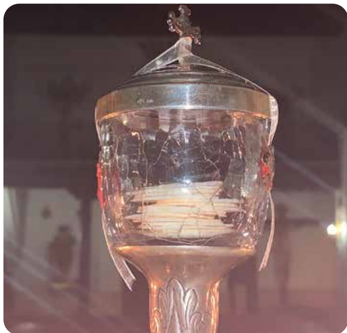
Las Sagradas Formas del Prodigio Eucarístico.