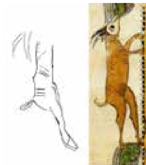
Figura 7: Calco de cabra localizada gracias a la fotogrametría y su comparación con una del Códice Albendense. Comienzo del índice de los Concilios (detalle de cabra) folio 70v (biblioteca Gonzalo de Berceo) año 970.