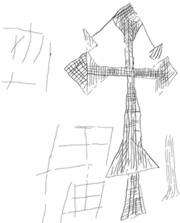
Figura 3: Calco de una nueva cruz, parrillas y grafitis geométricos. Descubiertos en el proceso fotogramétrico.

en Riocavado de la Sierra y en el termino de Cambrones en Mansilla de la Sierra . Estos dos yacimientos adscritos a época altomedieval con indudables influencias artísticas bizantinas, (esquematización de antropomorfos, grabados tipo parrilla, cruces decoradas con diente de sierra o de lobo, cúpulas califales, discos solares, etc.). También en el panel principal de Peña Hueca se descubrió la extraordinaria referencia arquitectónica al Monasterio de Suso y a San Millán y sus discípulos y eso planteó el presente proyecto. El objetivo del proyecto ha sido ampliamente logrado y en breve podremos dar a conocer esos resultados.