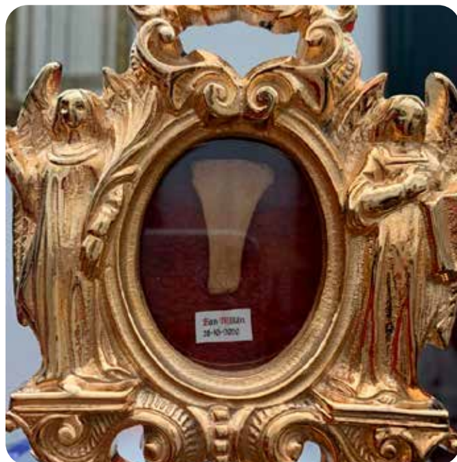
Reliquia de San Millán procedente del Monasterio de Yuso