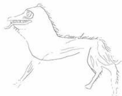
Figura 4: Fotogrametría y calco de unidad gráfica. Animal fantástico. A simple vista imposible de identificar.

Entre esos grafitis, se han localizado bestias fantásticas que parecen lobos, leones o cabras, trenzados muy semejantes a los que se pueden contemplar en los Códices, jinetes a caballo con lanzas y escudos lagrimales característicos de entre los siglos del siglo IX al XI y que también está en el Códice Emilianense, modelos de grabados arquitectónicos que tenemos en estudio y lo más espectacular: un trenzado con dos bestias adyacentes y una cruz griega o bizantina a su lado que podemos afirmar casi con toda seguridad se realizó cuando se estaba elaborando Códice Emilianense en el Monasterio. Es prácticamente una copia de uno de los bellos dibujos que se puede ver en sus páginas. Cuando entreguemos la correspondiente memoria lo daremos a conocer.