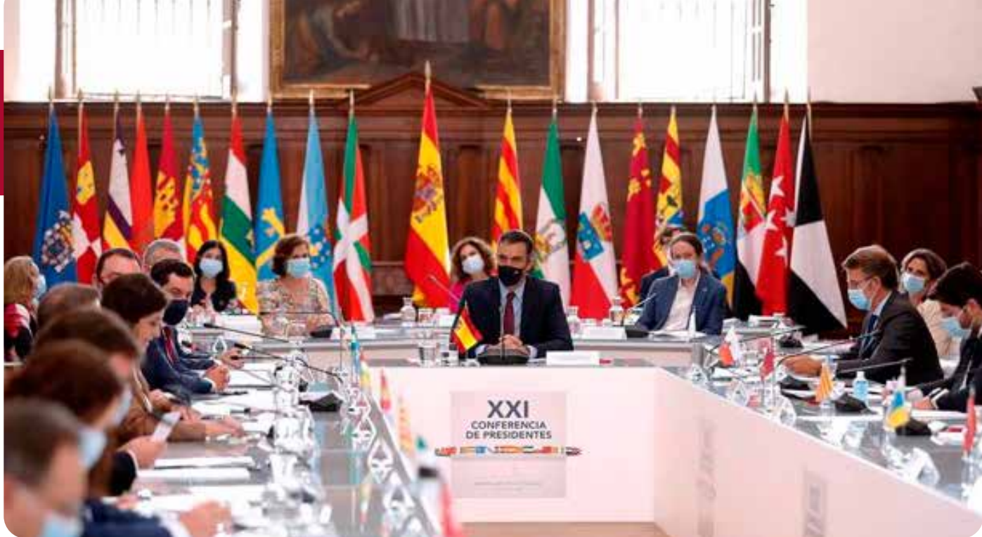
XXI Conferencia de Presidentes autonómicos celebrada en Yuso

Dada la gran presencia de periodistas que participaron para cubrir la información, el patio herreriano de la Hostería se equipó con todo tipo de medios para la retransmisión del evento. Además, para restar fuerza al sol, el patio se cubrió con tres toldos, que aliviaron a los más de 120 periodistas, en un día con una temperatura de 34 grados.