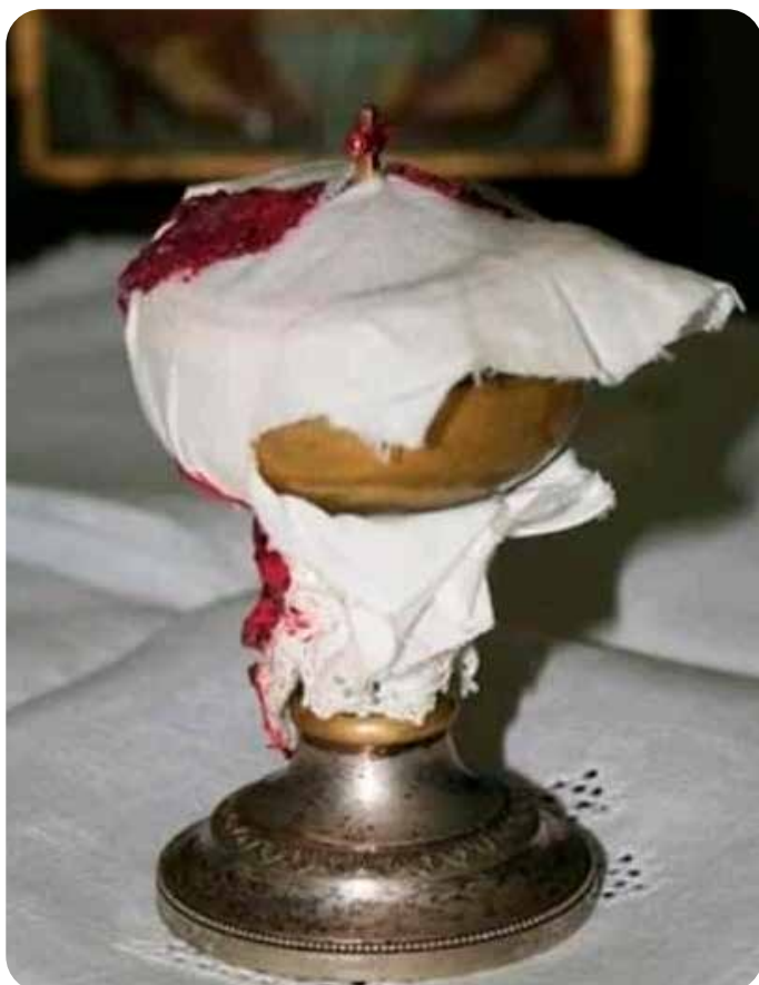
Foto Nº1 Coponcito original