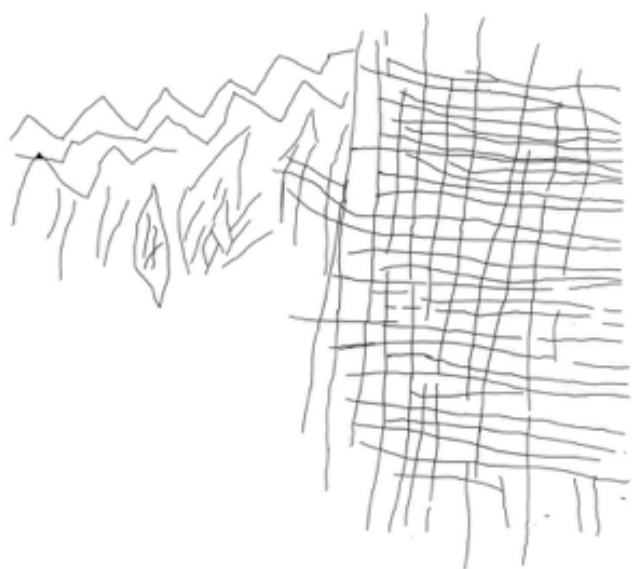
Figura 1: Calco de parrilla y decoración diente de sierra. Un ejemplo de los grafitis que se intentaba localizar en el Monasterio.