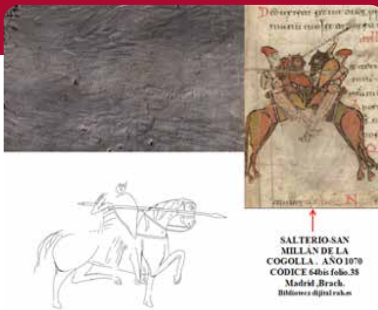
Figura 5: Fotogrametría de jinete- caballo y el calco correspondiente, localizado en el trabajo desarrollado por el equipo en este estudio en Monasterio de Suso. Con la lectura del calco de este grafiti, prácticamente ilegible a simple vista, se puede dar una adscripción aproximada gracias al escudo en forma de lágrima invertida que lleva el jinete y que su uso está datado entre los siglos X y XII. Su comparación con un dibujo del “Códice Emilianense 64 bis” datado en el año 1070 nos aproxima a las fechas en que fue realizado en una de las paredes del Monasterio de Suso.